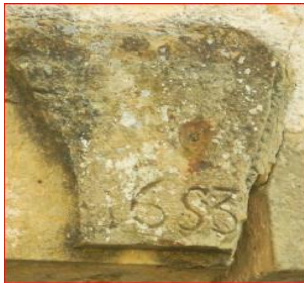
Linteau de l'église en date de 1653

La localité de Mallefougasse appartient au Vicomtes de Sisteron jusqu'en 1045 , puis elle est partagée entre l'abbaye Saint-Victor de Marseille et les chanoines de Forcalquier. En 1118 il est donné à l'abbaye Saint-André de Villeneuve-lès-Avignon qui possède le prieuré Saint Jean-Baptiste de Mallefougasse. L'église passe ensuite sous le contrôle de l'abbaye de Cruis.