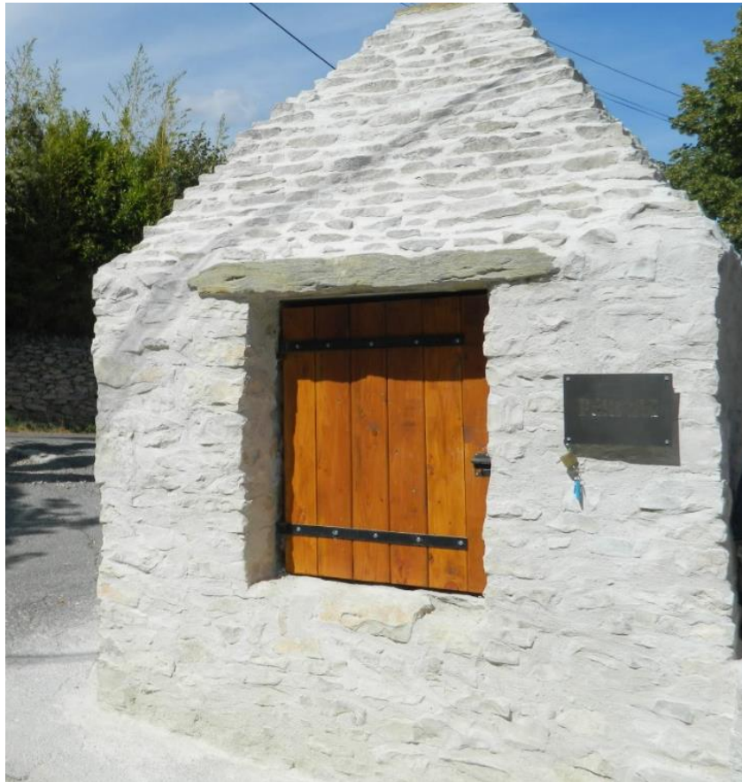
Puits de Mallefougasse.

Le problème le plus difficile à Mallefougasse, c'est qu'il n'y a ni rivière ni sources pour alimenter le village, seul un puits (22m de profondeur) et le secteur du lavoir sont alimentés en eau, mais ce dernier ne coule pas toute l'année. Pour essayer de pallier à ce manque d'eau, des citernes récupérant l'eau de pluie sont installées dans toutes les maisons du village. C'est ce manque d'eau qui sera à l'origine de la désertification de Mallefougasse ou il ne restait plus que 22 habitants au recensement de 1968 . Elle n'arrivera au robinet qu'en 1970 .